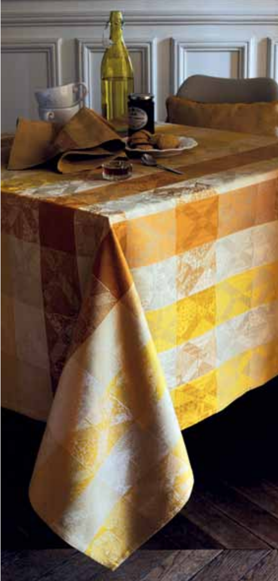
Mille losanges miel