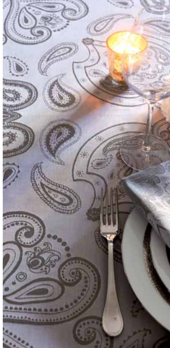
Pashmina marron glacé