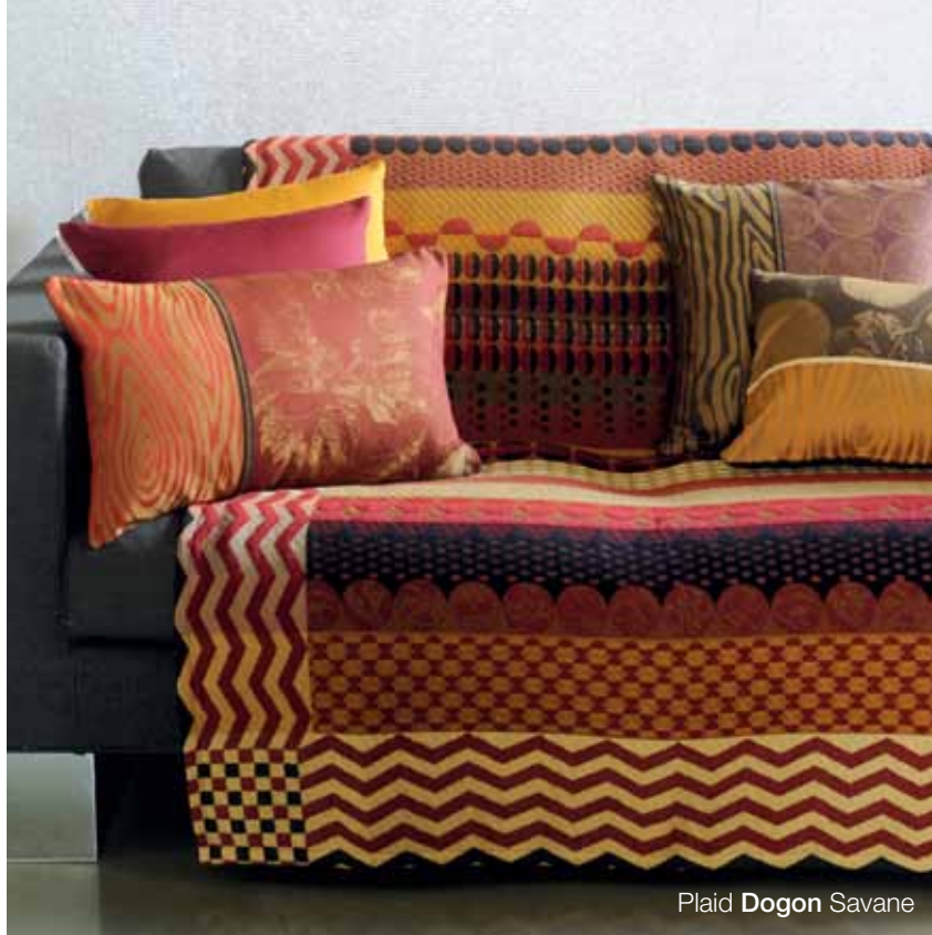
Plaid Dogon Savane