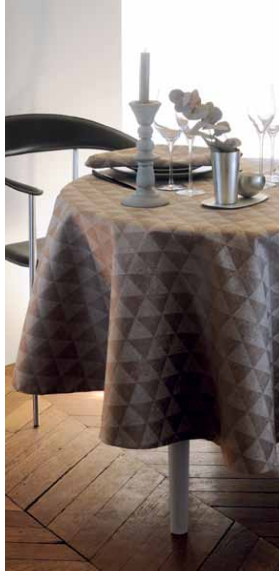
Mille spirit naturel