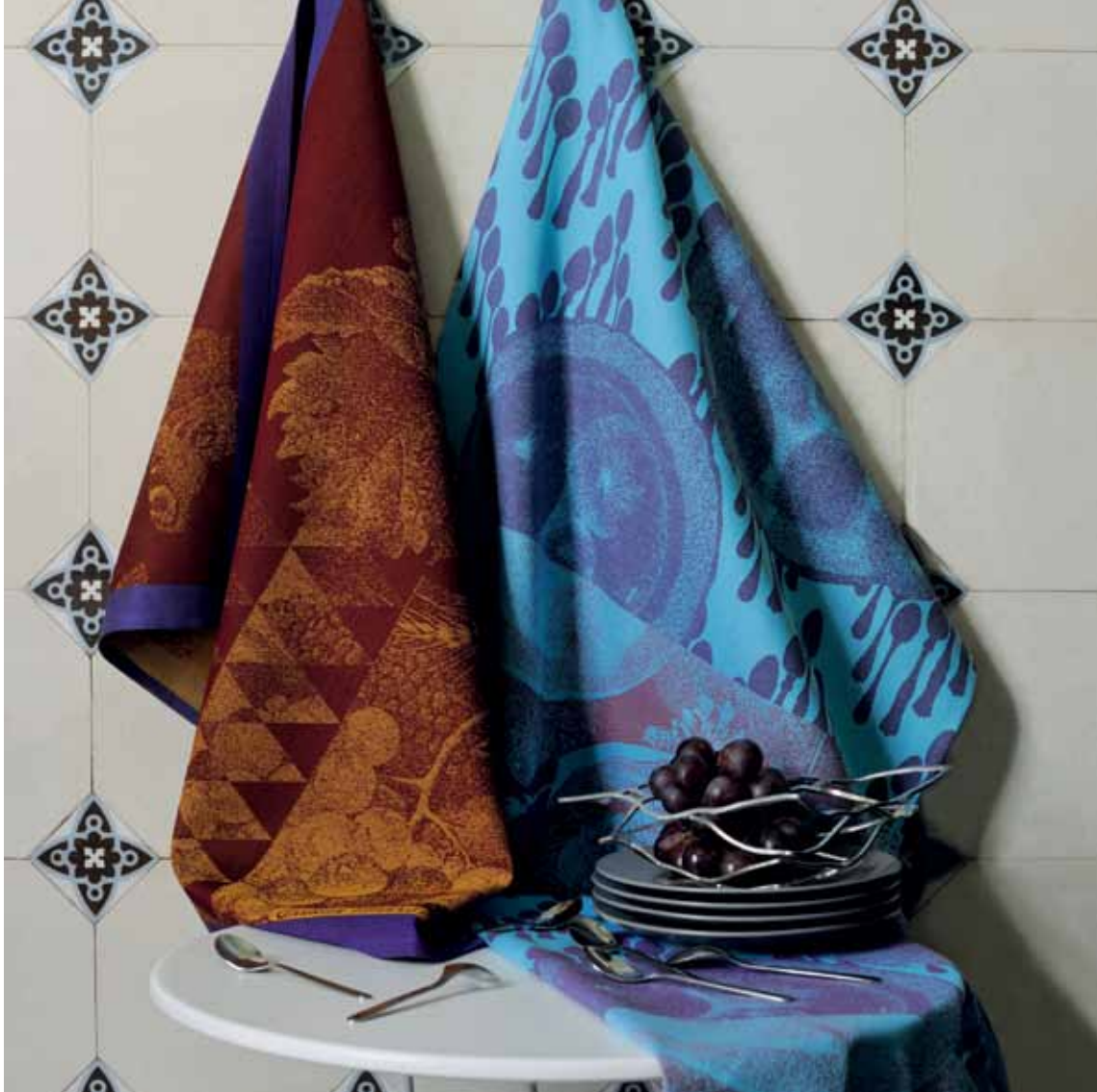
Abondance & Vanités Torçhons/Geschirrtücher/Kitchen towels