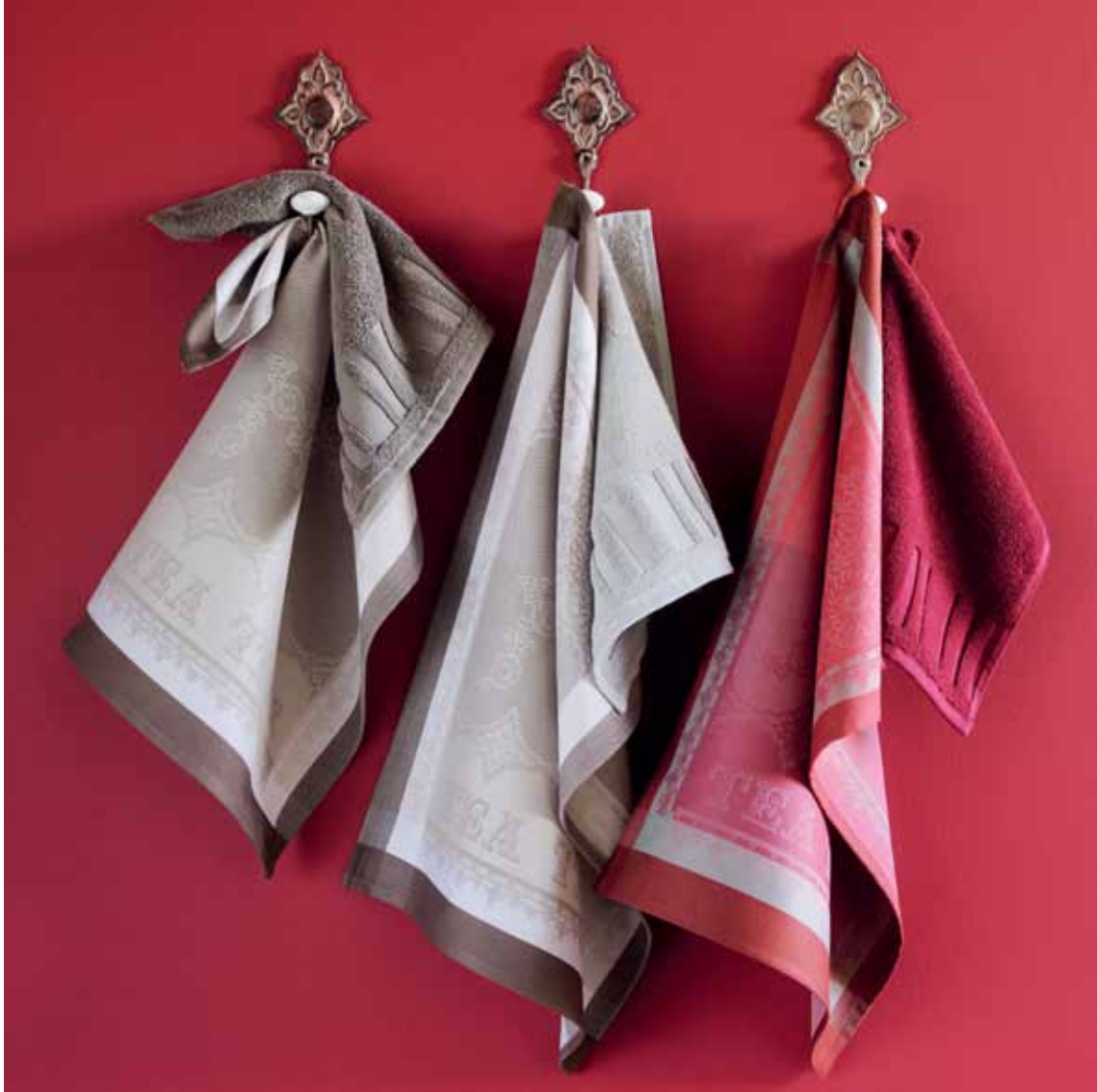
Cup of tea taupe/bordeaux & Carrés éponge Spa réglisse/galet/bordeaux Essuie-mains/Gästehandtücher/ Small kitchen towels