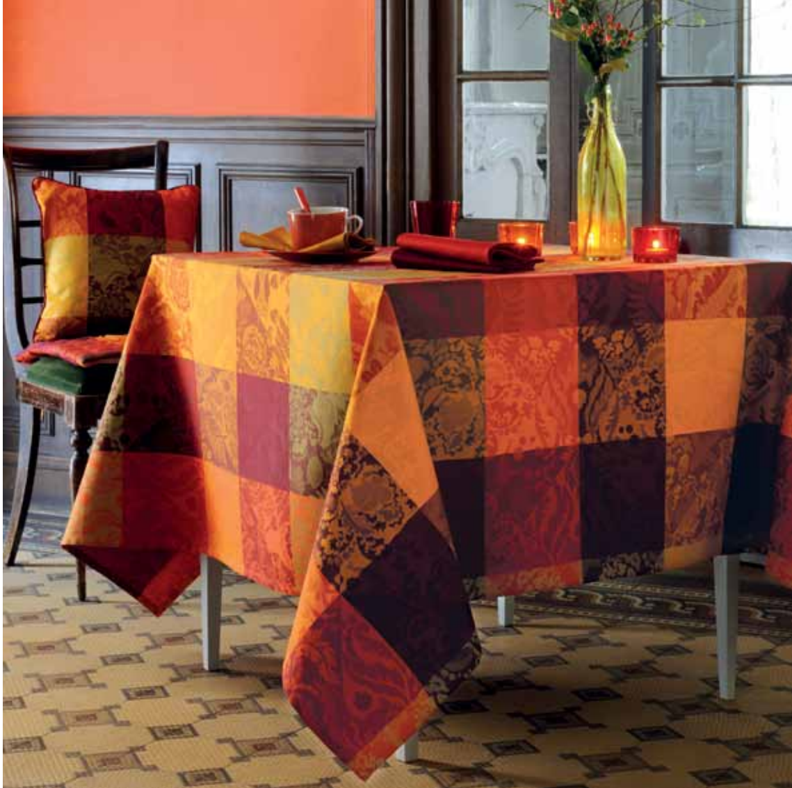
Mille ani flamboyant