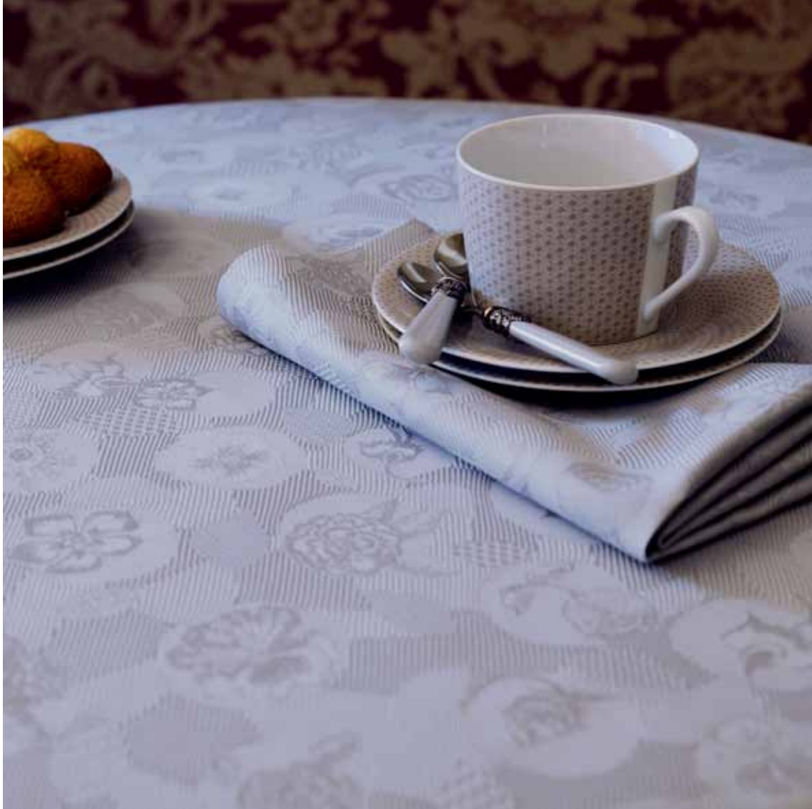
Mille pensées perle