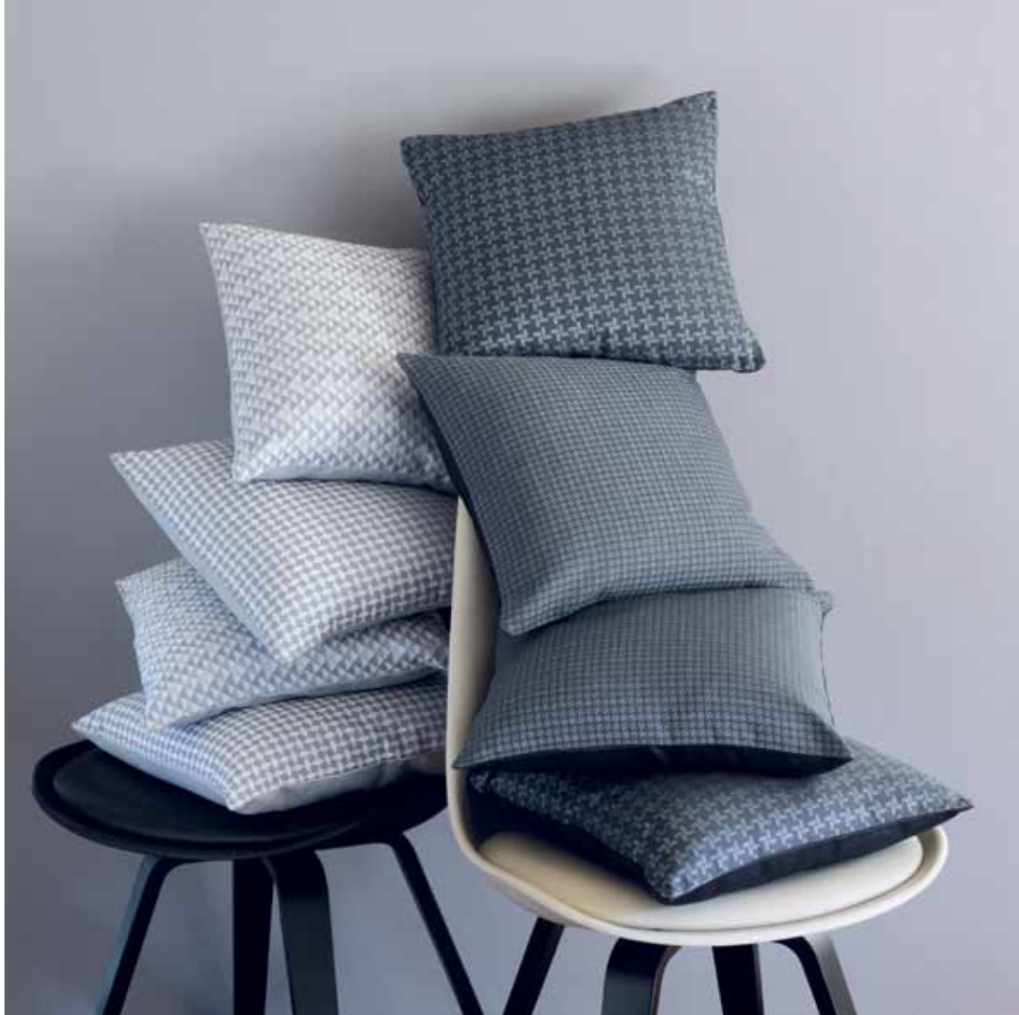
Reflection & Illusion grey/Kami & Origami denim