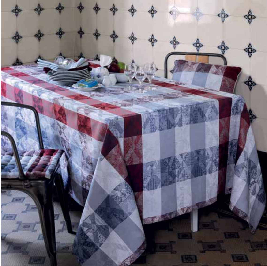
Mille losanges fog